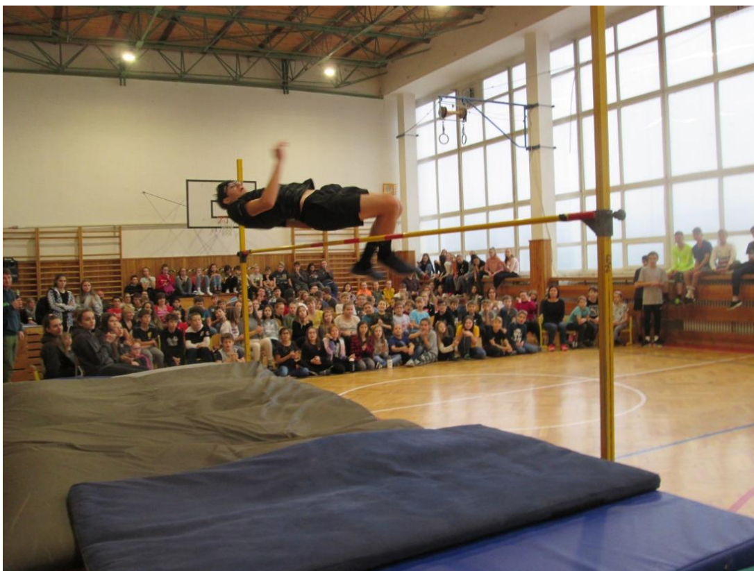
Mikulášská laťka 2019