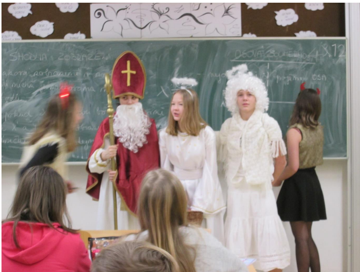
Mikulášská besídka - výstava Poklad Inků